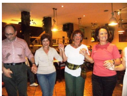
Immagine dall'ultimo incontro Alpe Adria, in Slovenia

Alle ultime edizioni hanno partecipato persone provenienti da Italia, Austria, Slovenia, Croazia, Ungheria, ma anche da Svizzera, Francia e Germania. Nel 2010, in Slovenia, hanno partecipato 65 persone.